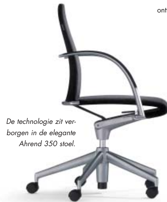
De technologie zit ver- borgen in de elegante Ahrend 350 stoel.