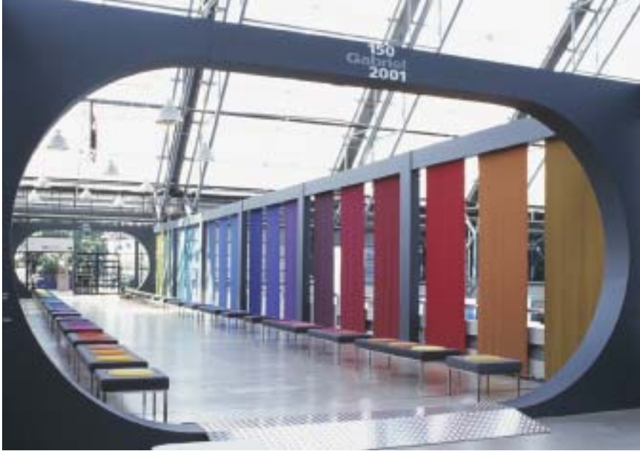
Speciale tentoonstelling op de Scandinavian Furniture Fair.